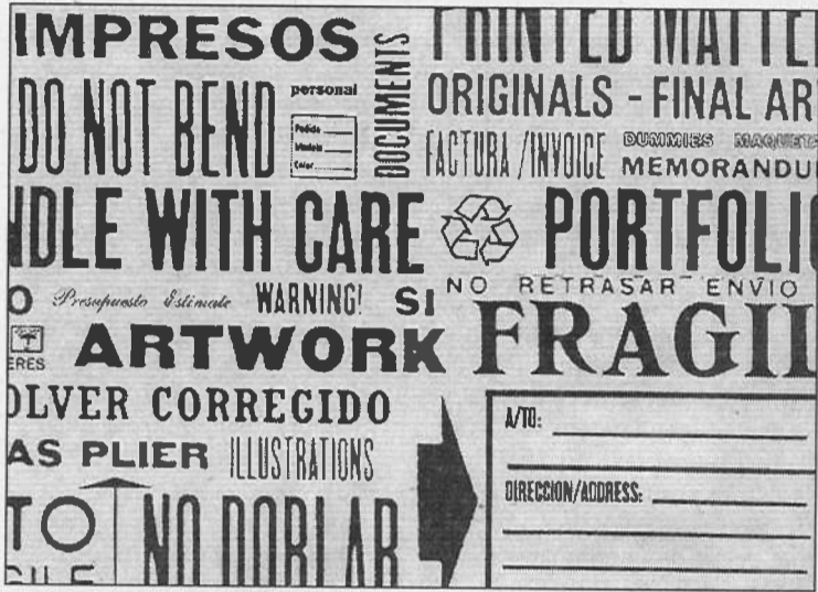
El sobre dissenyat per Duró s'exposa a Madrid.

El centre aplega a Madrid mil peces de 500 autors, fetes al llarg dels darrers cent anys