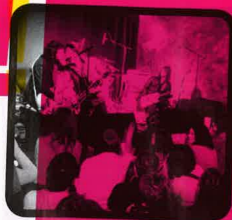
Les Golfes Club